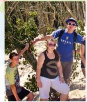
Na ruchomych wydmach